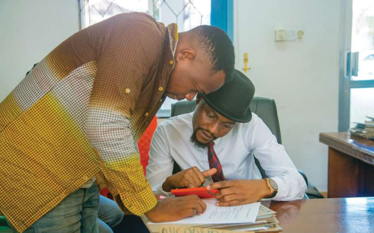
Msanii wa Muziki Darasa (kulia) akiwa pamoja na meneja wake katika ofisi ya COSOTA wakijaza fomu ya taarifa za kibenki kwa ajili ya kulipwa mrabaha aliyopata msanii huyo katika mgao uliotangazwa Januari 28, 2022.