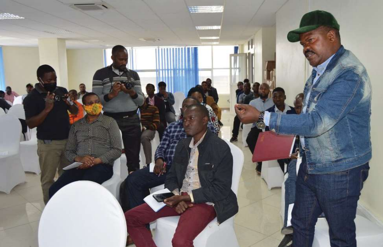
Wamiliki wa Vyombo vya Habari Nyanda za Juu Kusini wakitoa maoni katika Kanuni ya Leseni ya Utangazaji na Maonesho kwa Umma kwa Maafisa wa COSOTA (hawapo pichani) kikao hicho kilichofanyika Jijini Mbeya Agosti 2021.