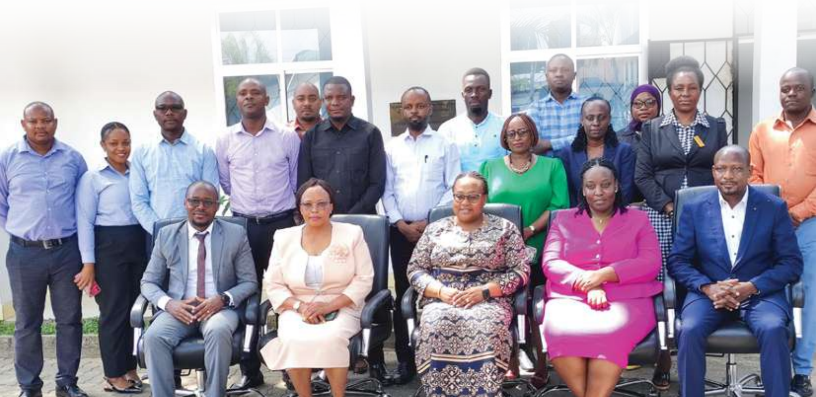
Maafisa wa Ofisi ya Hakimiliki Tanzania wakiwa katika picha ya pamoja na Waziri wa Utamaduni, Sanaa na Michezo Mhe.Balozi Dkt. Pindi Chana, alipotembelea Ofisi hiyo Februari 21,2023, Jijini DSM.

Nayo Ofisi imefanikiwa kushirikiana na mashirika ya Kimataifa, Kikanda na Vyama dada vinavyosimamia hakimiliki na kuboresha usimamizi wa hakimiliki nchini. Shirika la Miliki Ubunifu Duniani (World Intellectual Property Organization - WIPO), Shirika la Miliki Bunifu Afrika (African Regional Intellectual Property Organization - ARIPO), Shirika la Umoja wa Watunzi na Wasanii (Confederation of Composers and Authors Societies - CISAC), Shirikisho la Kusimamia Kazi za Maandishi Duniani (International Federation of Reproductions Rights Organisation - IFRRO) na International Federation of Phonographic Industries - IFPI).