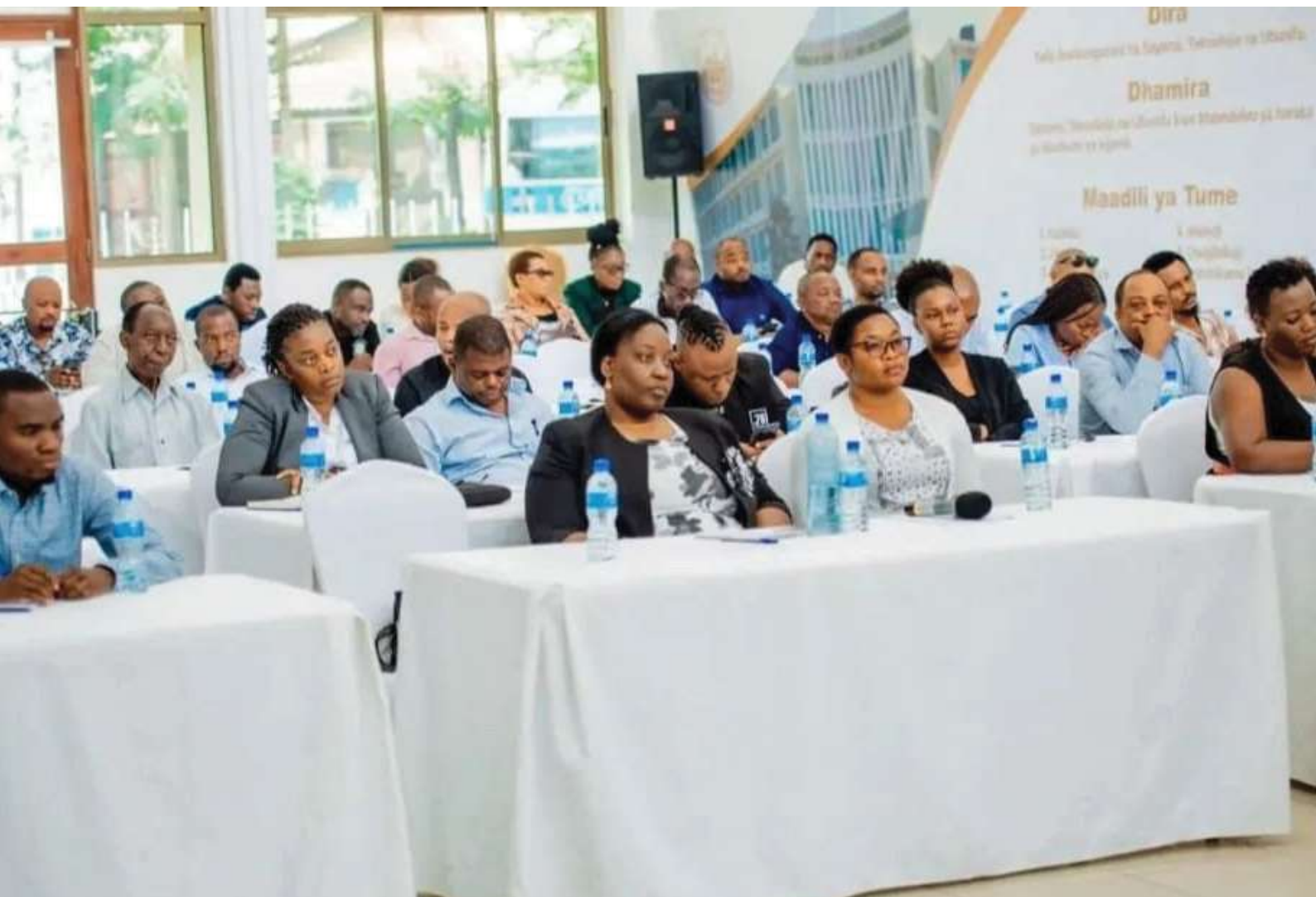
Wadau wa Ubunifu wakiwa katika kikao cha kutoa maoni kwa Kamati teule ya ya namna bora ya kusimamia hakimiliki nchini Jijini Dar es Salaam.